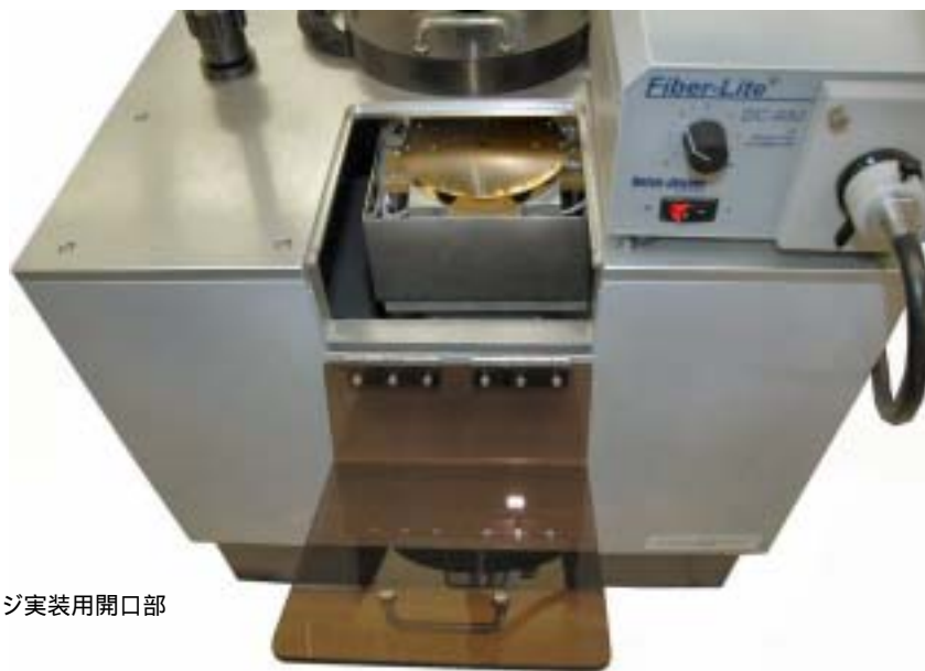
ステージ実装用開口部